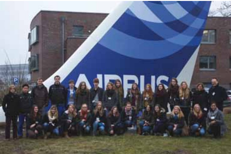
Les élèves de 3 ème du lycée Athenaeum lors de la Journée Découverte chez Airbus à Stade Schüler der 10. Klasse des Gymnasiums Athenaeum beim Entdeckungstag im AIRBUS-Werk in Stade

BASF est un groupe industriel allemand qui est implanté sur de nombreux sites en France ; c'est donc tout naturellement que BASF en France a souhaité s'associer à la démarche de l'OFAJ depuis maintenant près de 4 ans.