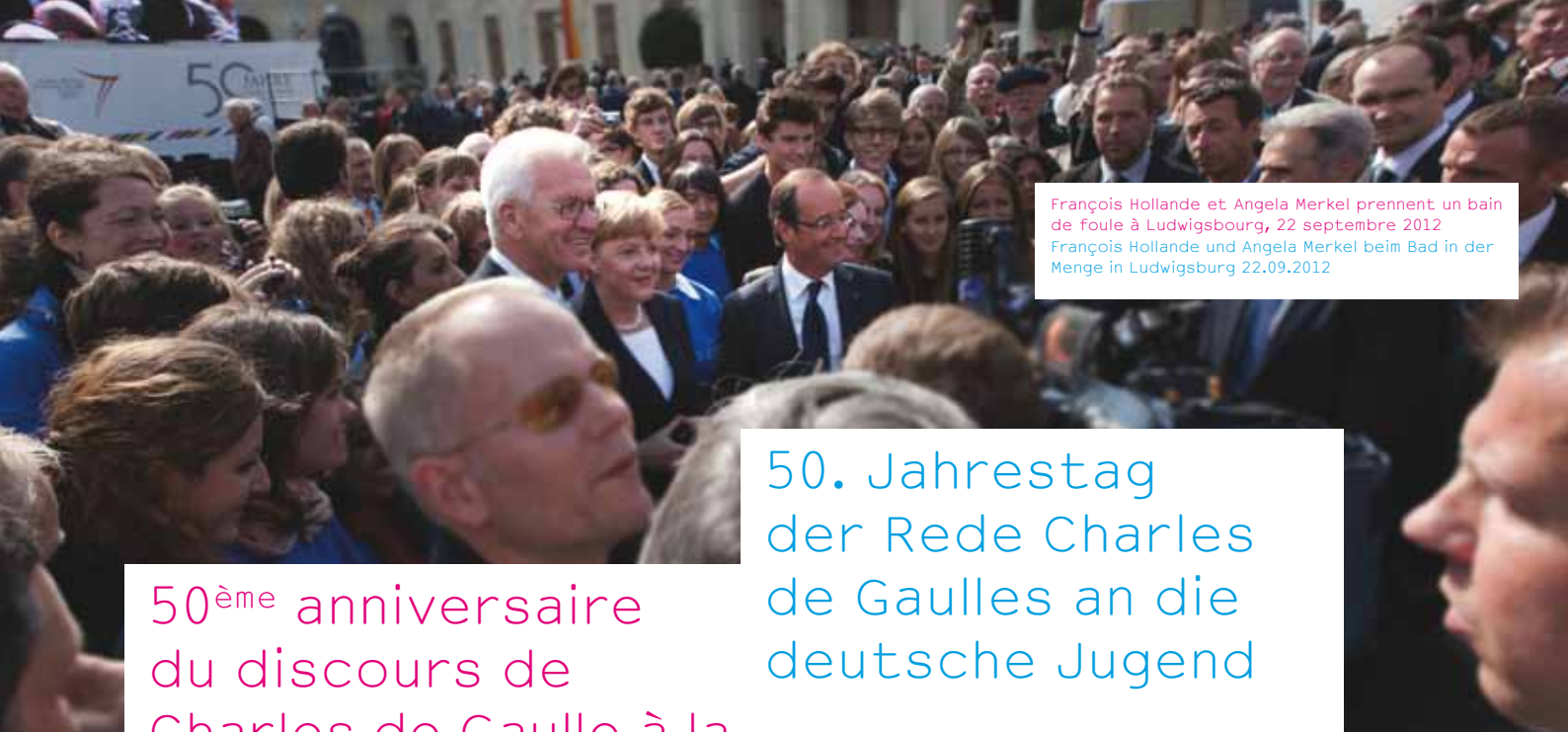
François Hollande et Angela Merkel prennent un bain de foule à Ludwigsbourg, 22 septembre 2012 François Hollande und Angela Merkel beim Bad in der Menge in Ludwigsburg 22.09.2012