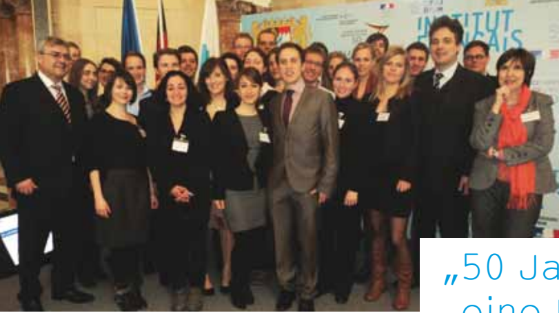
Die Teilnehmer des akademischen Workshops Les participants à l'atelier universitaire