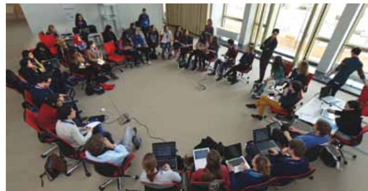
Les participants au Forum de Jeunes OFAJ pendant une session BarCamp Die Teilnehmer des DFJW-Jugendforums während einer BarCamp-Session